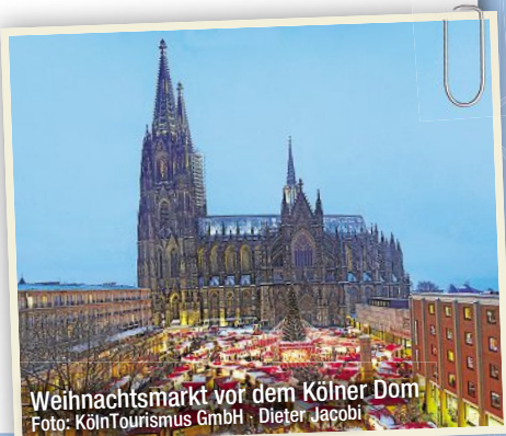
Weihnachtsmarkt vor dem Kölner Dom

Termin: 23.12.2014–01.01.2015 Preis ab: 1.299 € p.P. in 2-Bett-Kab.